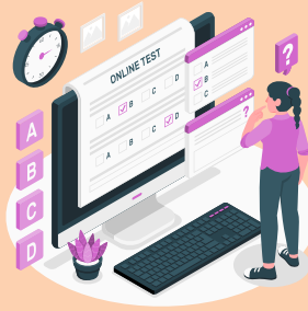
Online Test Series & Quiz